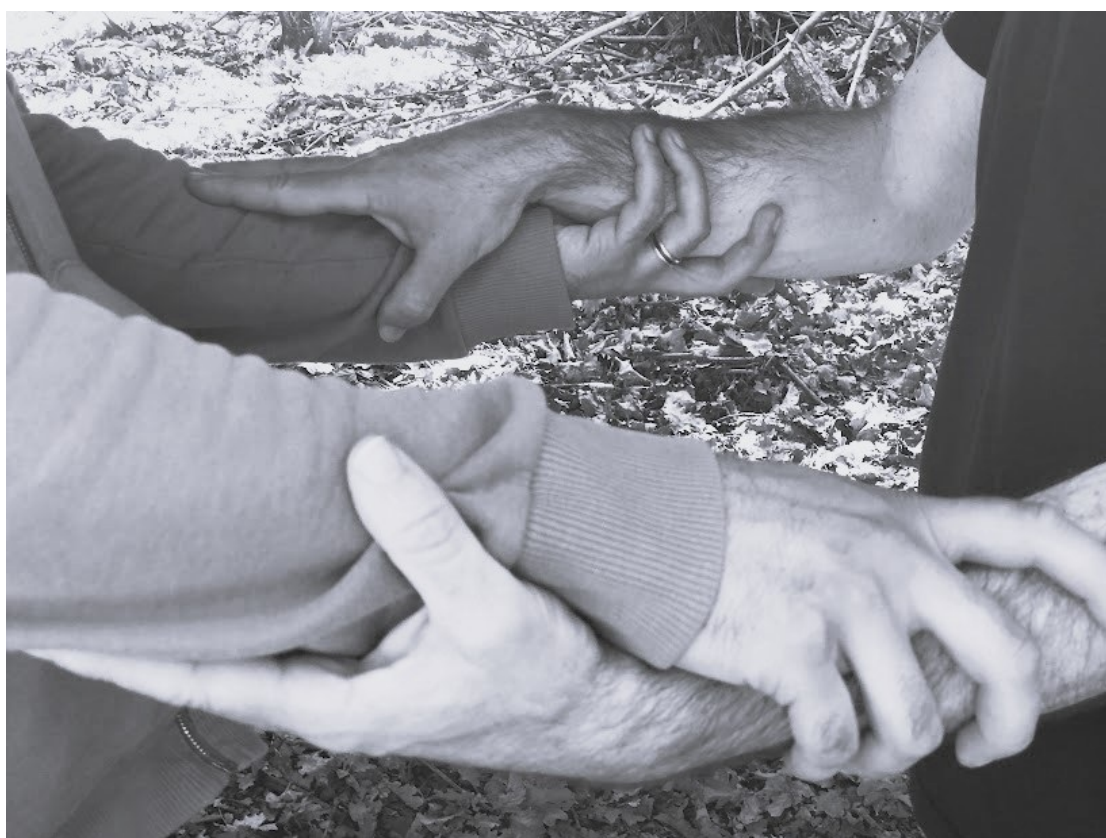
Au cœur du Masculin, photo Jérôme Lavens, avril 2023